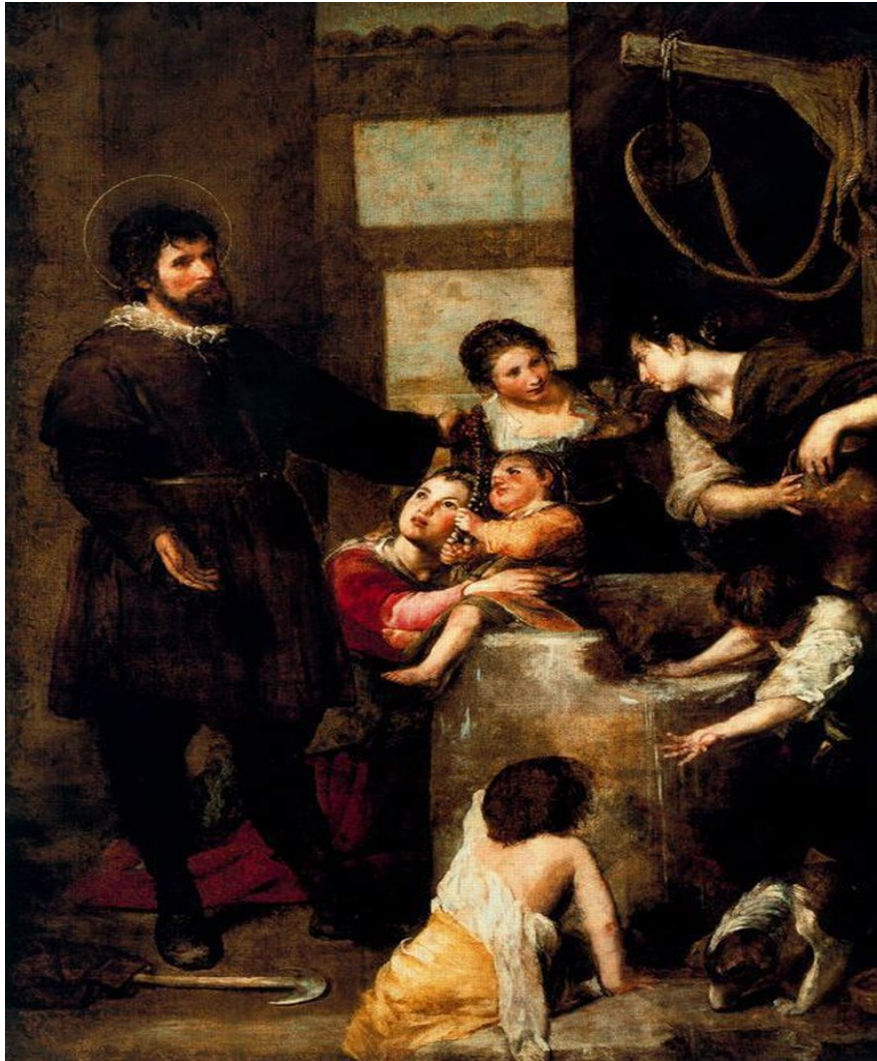
El milagro del pozo. 1638. Museo del Prado

La obra se resuelve a base de tonos cálidos y mediante una factura libre y desecha. Maestría narrativa: hay variedad sin que exista dispersión. Tipos humanos y detalles de gran belleza