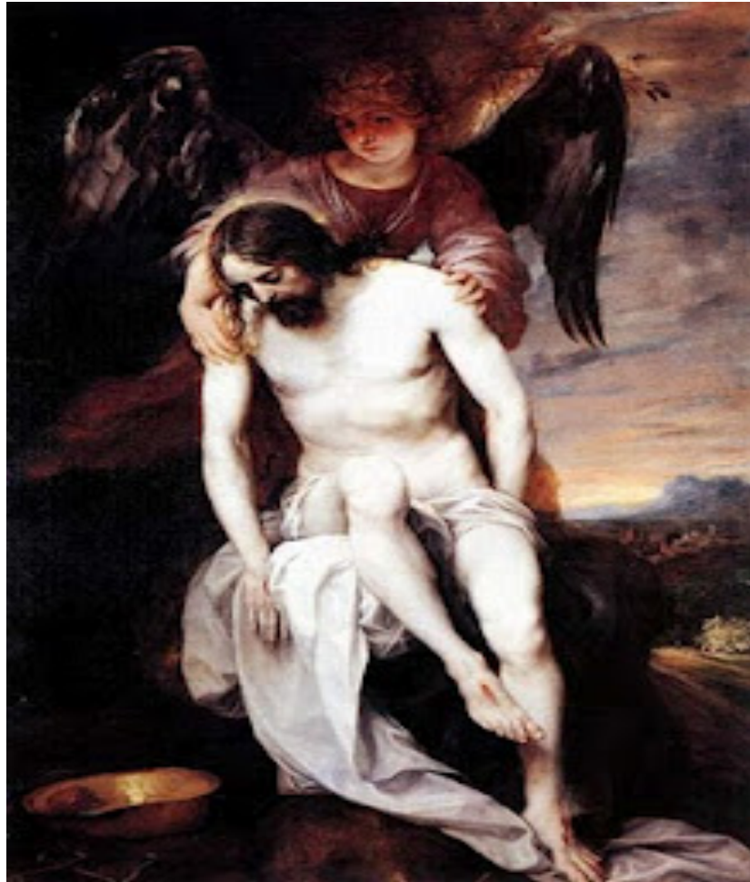
Cristo muerto sostenido por un ángel. 1652. Museo del Prado

Escena dramática tratada con expresividad gestual mínima. Gusto por la belleza, la contención y la medida. Rebosa quietud y misterio. Invita a la meditación profunda