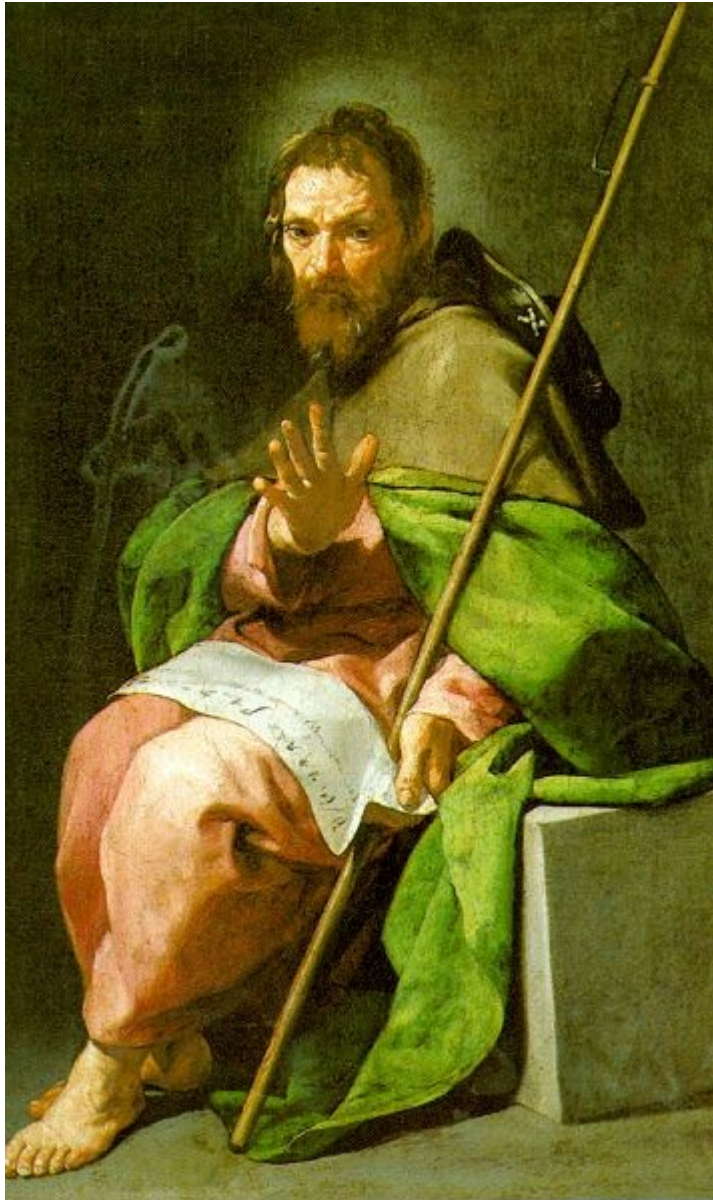
Santiago . 1635. Museo del Louvre. París

Rotundidad escultórica y notabilísimo escorzo, de tonalidad cromática suave