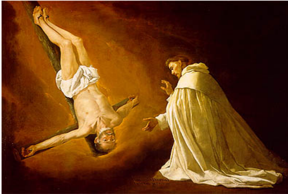
Aparición de San Pedro a San Pedro Nolasco. 1629. Museo del Prado

Severa monumentalidad y profunda emoción. Intensidad estremecedora en el cuerpo inerte del mártir. Perfección técnica en los pliegues.