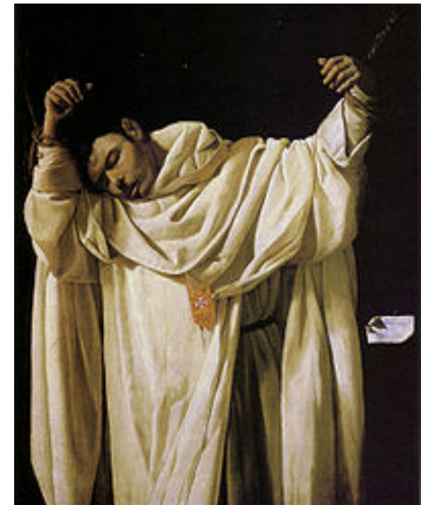
San Serapio mártir. 1628. Wadsworth Atheneum. Hartford

Severa monumentalidad y profunda emoción. Intensidad estremecedora en el cuerpo inerte del mártir. Perfección técnica en los pliegues.