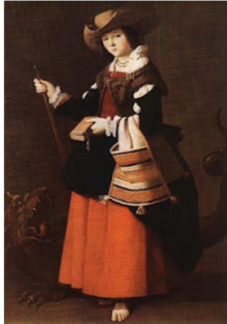
Santa Margarita. 1640. National Gallery. Londres