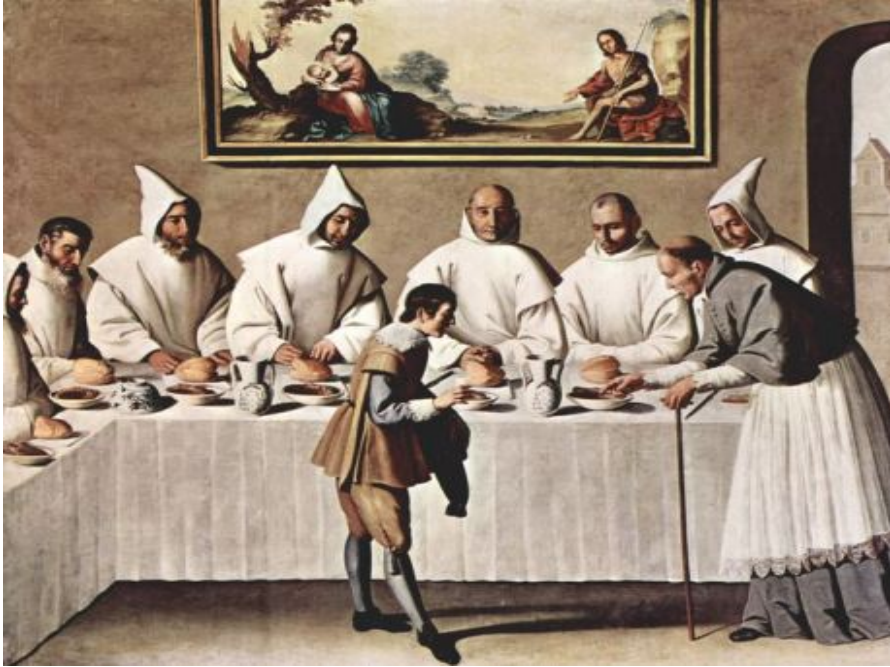
San Hugo en el refectorio 1655. Museo de Bellas Artes. Sevilla

Simplicidad compositiva y limitación espacial