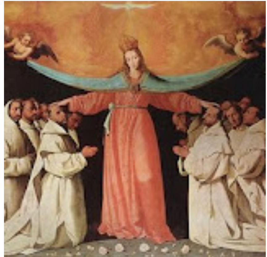
Virgen de los cartujos. 1655. Museo de Bellas Artes. Sevilla

Simplicidad compositiva y limitación espacial