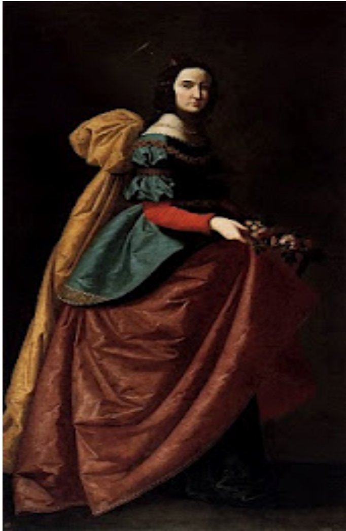
Santa Casilda. 1640. Museo del Prado